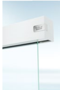
Die elegante Formensprache integriert gekonnt komplexe Technik.

Glasschiebetüren an sich sind schon wahre Raumwunder. Das kompakte Schiebetürsystem MUTO Premium Telescopic 80 setzt bei großen Türöffnungen in puncto Raumnutzung noch einen drauf: Beim Öffnen werden die Türflügel platzsparend voreinander geparkt. Das ermöglicht auch bei wenig freier Wandfläche mehr Durchgangsbreite mit maximaler Transparenz.