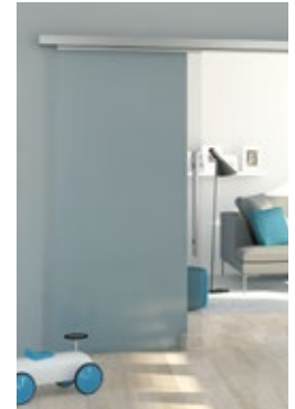
Teleskopvariante: Platzsparende Türöffnung für große Wandöffnungen.